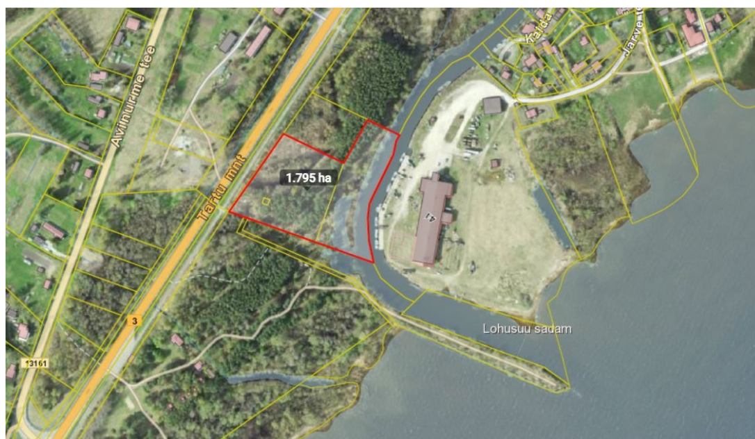
Joonis: Projektala asukoht ja ümbruskond.

Mustvee Vallavalitsus taotleb keskkonnaluba Avijõe (VEE1056900) süvendamiseks mahus 2300 m 3 ja tahkete ainete uputamiseks mahus 500 m 3 . Kavandatava tegevuse eesmärk on Lohusuu aleviku puhkealale avalikult kasutatava juurdepääsutee, paadislipi ja ujuvkai ehitamine. Tegevuskoht asub aadressil Puhkeala sadam (registriora nr 2762950, katastritunnus 42001:001:0598) Lohusuu alevikus Mustvee vallas Jõgeva maakonnas.